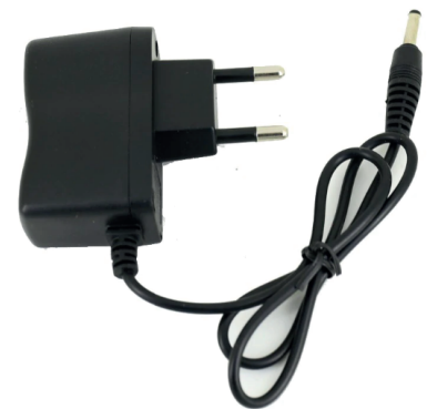
Power adapter / charger