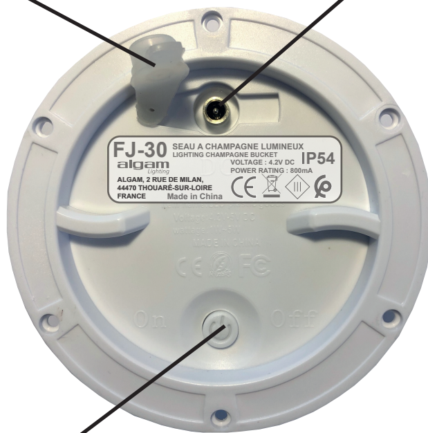
ON/OFF mains switch